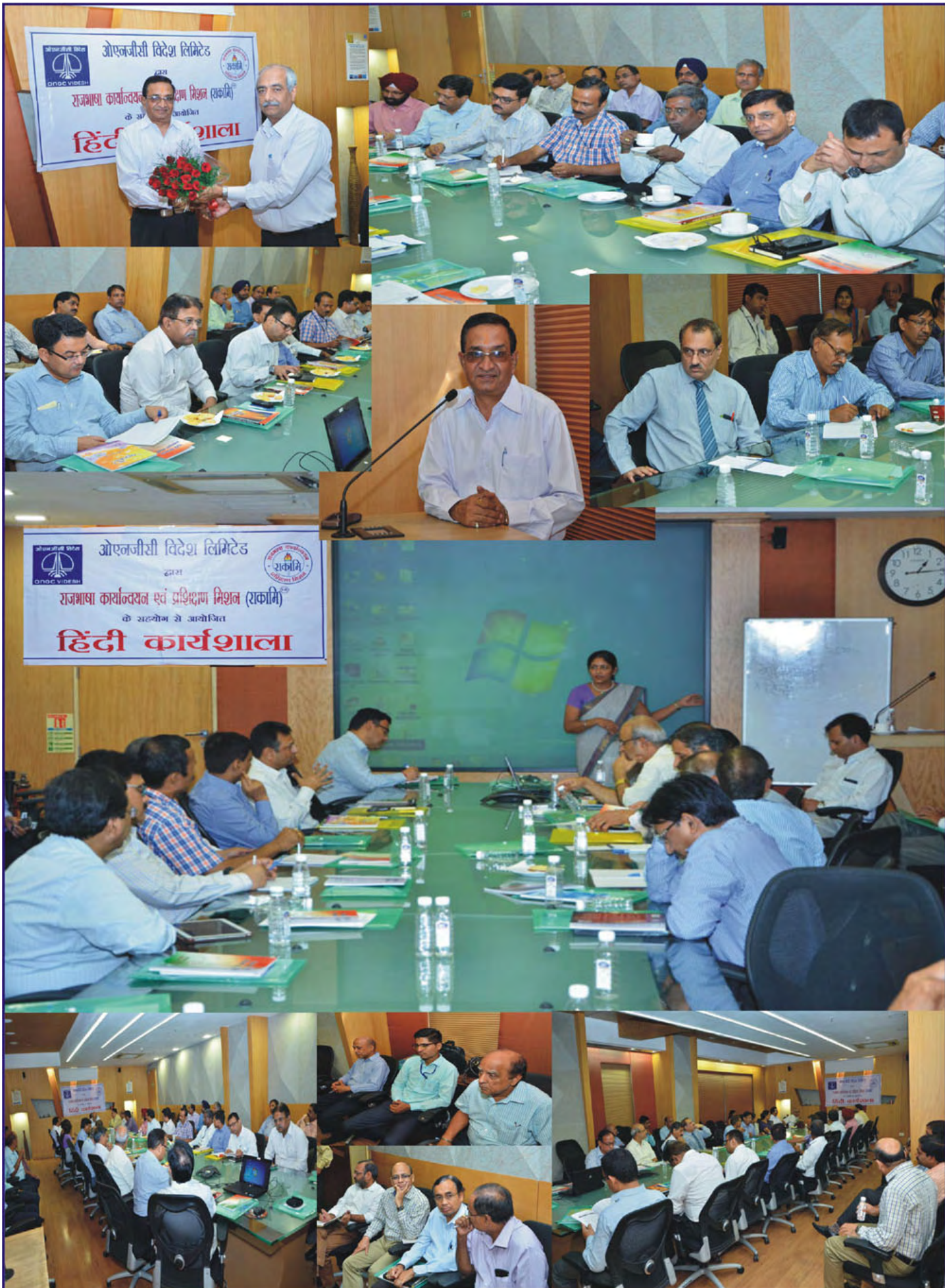
राजभाषा कार्यान्वयन एवं प्रशिक्षण मिशन (राकामि) द्वारा दिनांक 21 सितंबर, 2015 को ओएनजीसी विदेश लिमिटेड, नई दिल्ली के सहयोग से आयोजित हिंदी कार्यशाला की झलकियां