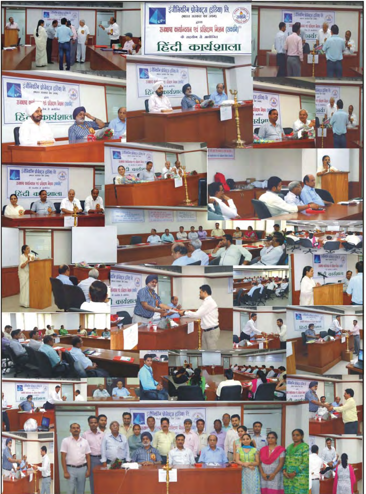
राजभाषा कार्यान्वयन एवं प्रशिक्षण मिशन (राकाभि) द्वारा दिनांक 11 जून, 2015 को इंजीनियरिंग प्रोजेक्ट्स (इंडिया) लि., नई दिल्ली के सहयोग से आयोजित हिंदी कार्यशाला की झलकियां