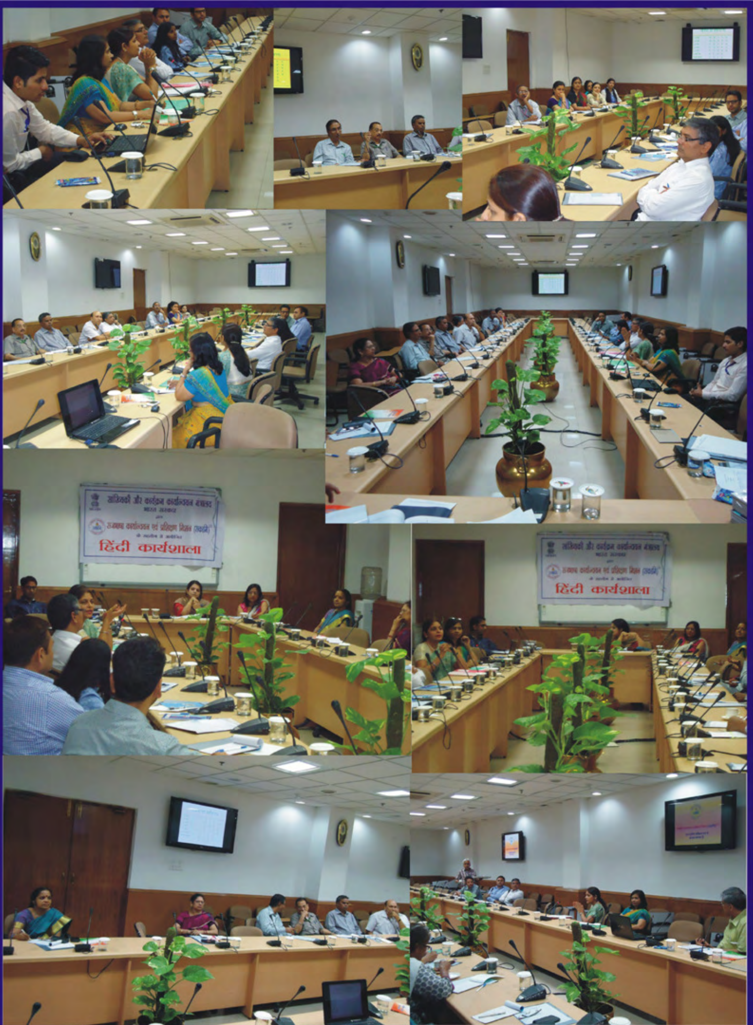
दिनांक 19 अक्टूबर, 2015 को सांख्यिकी और कार्यक्रम कार्यान्वयन मंत्रालय, भारत सरकार में राजभाषा कार्यान्वयन एवं प्रशिक्षण मिशन (राकामि) के सहयोग से आयोजित हिंदी कार्यशाला की झलकियां