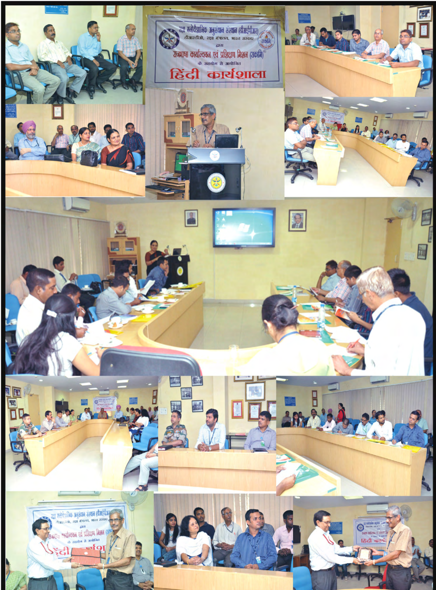
दिनांक 14 अगस्त, 2015 को डीआईपीआर, डीआरडीओ, रक्षा मंत्रालय, भारत सरकार में राजभाषा कार्यन्वयन एवं प्रशिक्षण मिशन (राकामि) के सहयोग से आयोजित हिंदी कार्यशाला की झलकियां